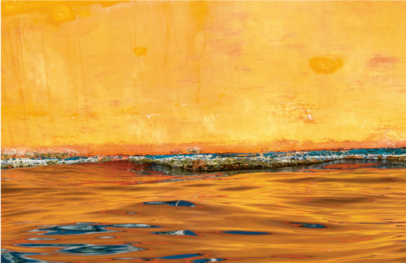
Degoša tukšaine | Burning Outback 2019. gada 16. augusts | August 16, 2019