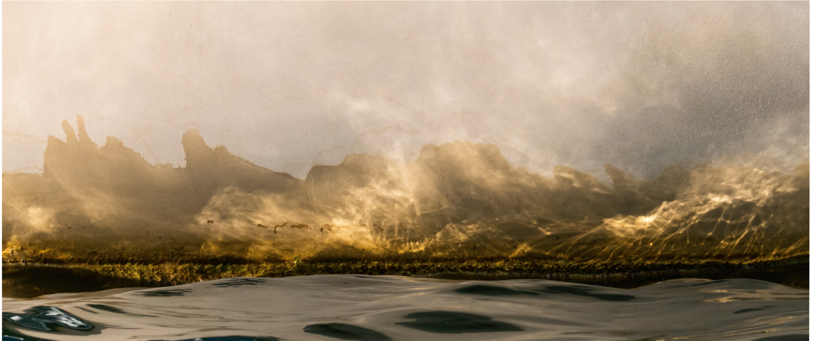
Tērners ainavas impresijas 3 | Impressions of a Turner Landscape 3